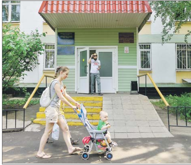
У входа в поликлинику №179