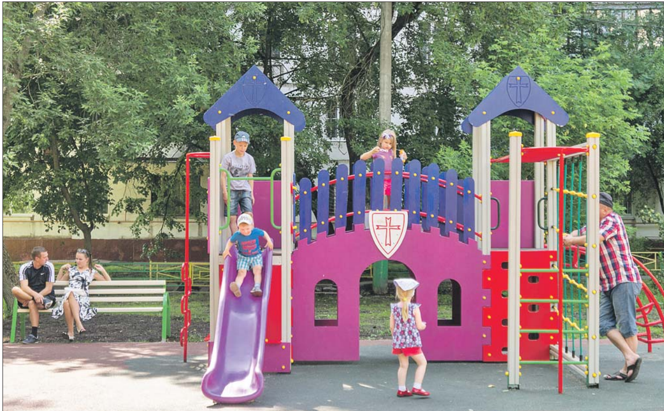
Детская площадка во дворе дома 40, корп. 2, на Путевом проезде

Завершилось благоустройство пяти дворов района