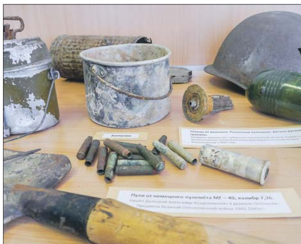
Экспонаты музея школы №1370 (корп. 4) на Бибиревской

Музей основан в 1990 году и носит название «Служение Отечеству — долг гражданина». Он посвящён 907-му истребительному авиационному полку особого назначения, в котором во время войны нес службу родственник основателя музея Елены Дорофеевой. Все экспонаты из семейных архивов сюда принесли ученики: фотографии, копии фронтовых писем, военные документы, каски, гильзы, есть даже трофейная печатная машинка. К конкурсу школьники подготовили ещё и плакаты, в которых отразили историю военных лет