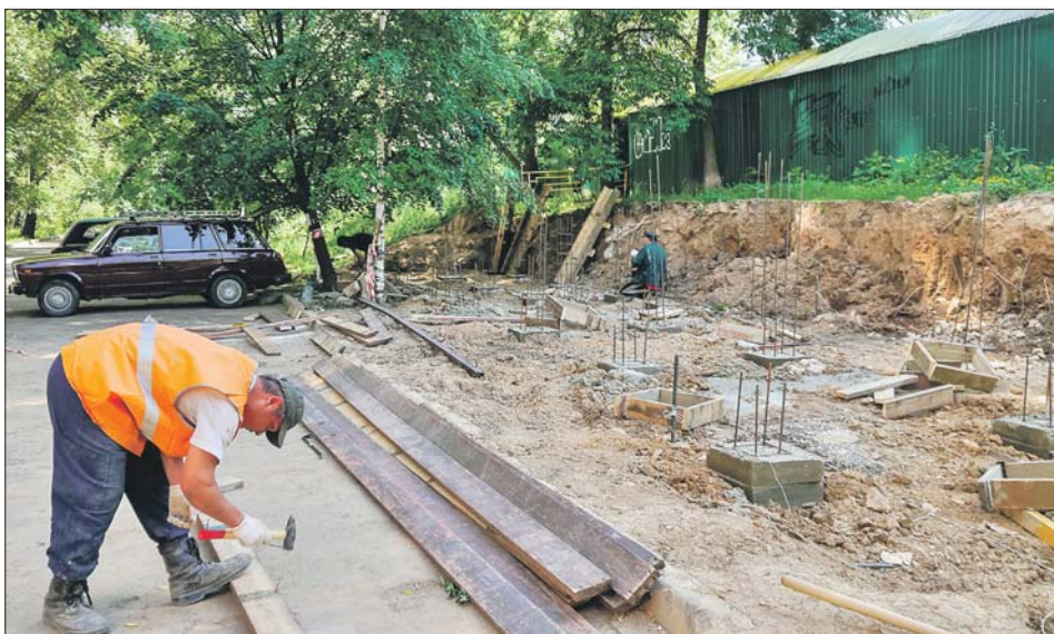
Подготовительные работы к реконструкции лестницы во дворе на Костромской

— Управа обратилась в Департамент имущества с конкретным предложением — создать по этому адресу