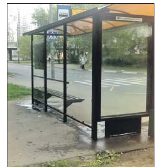
по остеклению этого павильона.

За прошедший месяц на портал «Наш город» от жителей района поступило более 100 обращений. Например, было сообщение о том, что в остановочном павильоне по адресу: Путевой пр., 2 (остановка «Металлобаза»), отсутствуют стёкла. Из Департамента транспорта и развития дорожно-транспортной инфраструктуры г. Москвы пришёл ответ, что 17 мая были проведены работы