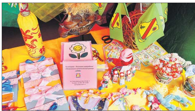
Поделки школьников для благотворительной ярмарки

Ученики школ района №305 и 1370, а также дети из досугово-спортивного центра «ЭПИ-Алтуфьево» представили свои творческие работы и поделки на благотворительной ярмарке в Гончаровском парке во время окружного фестиваля, посвящённого 700-летию со дня рождения Сергия Радонежского. Приобретая сувениры, посетители ярмарки жертвовали деньги на храм во имя Собора Московских Святых, который строится на Костромской улице. Школьникам Алтуфьева удалось