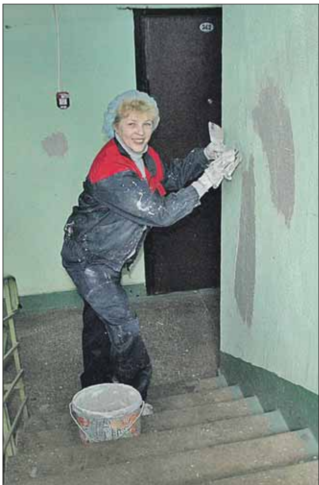
Ремонт 8-го подъезда на Бибиревской, 17, уже начался

Какого именно цвета будут стены в подъезде, решают жители. Любимые тона алтуфьевцев — нежно-бежевый, персиковый, фисташковый. Краску теперь исполь-