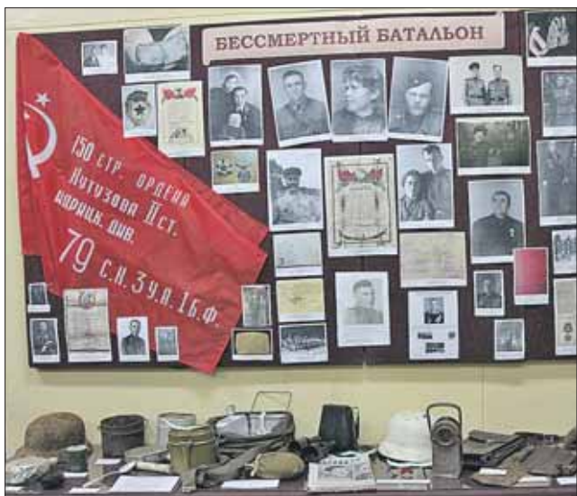
В музей школы №1370, корпус 2, ученики приносят фотографии своих прадедов-фронтовиков

Школьных музеев у нас в районе пять. Многие экспонаты дети и подростки делают своими руками. Гордость музея декоративно-прикладного искусства школы №1370, корпус 2, на Костромской, — изделия из бисера. А для экспозиции в честь 70-летия Победы ученики