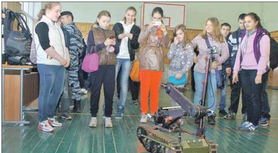
Ребята увидели робота-сапёра...

— В таких случаях мы сначала интересуемся мнением большинства жителей дома. Если они считают, что им нужен газон — сделаем газон,