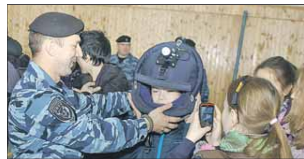
...и примерили снаряжение сапёра

За три часа экскурсии подростки познакомились с солдатской службой, пообщались с офицерами, побывали в музее воинской части и попробовали армейский обед — гречку с тушёной. Кроме того, школьники получили уникальную возможность сделать фото на память, сидя в бронетранспортёре, потрогать снайперские винтовки и