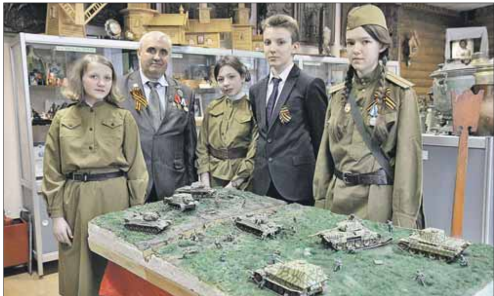
Диорама «Битва на Курской дуге» в музее школы №305, корпус 1