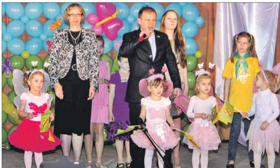
На открытии фестиваля