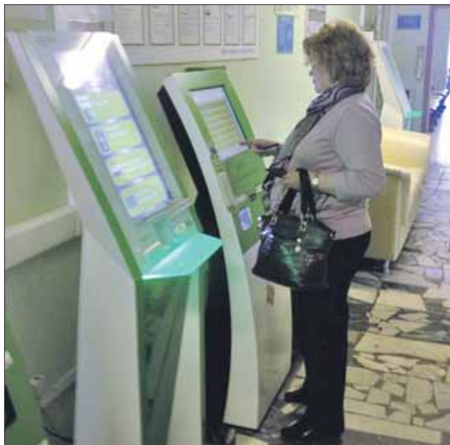
Записаться к врачу можно несколькими способами, например по инфомату

лог, пульмонолог, гастроэнтеролог, приходят в поликлинику на Инженерной и консультируют пациентов. Жители Алтуфьева теперь имеют возможность пользоваться ресурсами диагностического центра №5, например сделать компьютерную томографию, полный биохимический анализ крови. Кроме того, поликлиника получила новый геммоанализатор, аппарат УЗИ, новый рентгеновский аппарат, который,