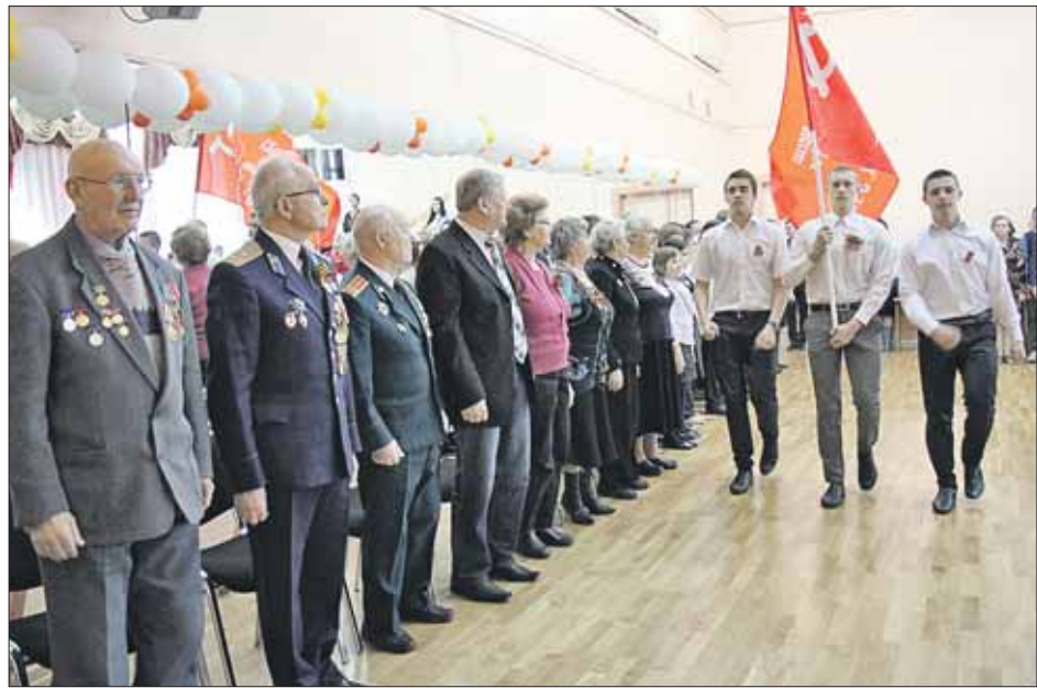
Вынос Знамени Победы