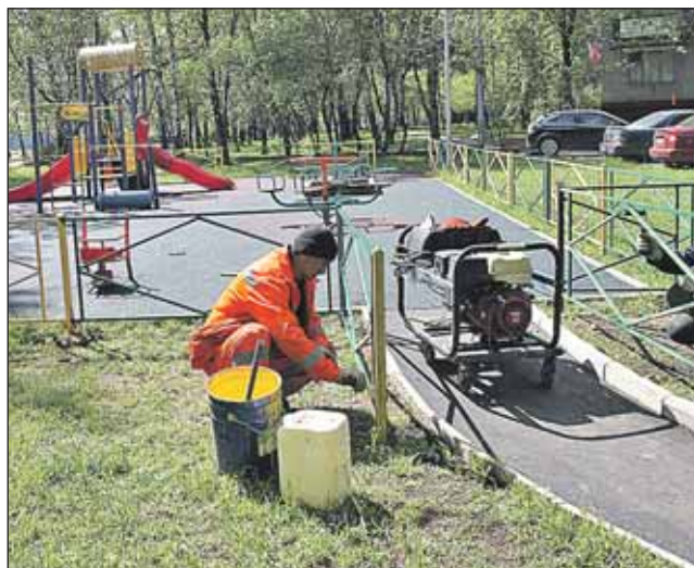
Благоустройство двора на Путевом проезде, 6

сле этого люди смогут подать заявку — какого числа готовы переехать в новый дом. К тому же на подъездах разместят объявления с номерами телефонов, по которым можно будет сообщить о дате переезда. Это будут телефоны либо управы, либо ДЕЗА.